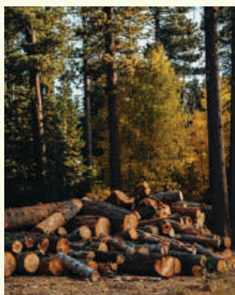
孟夏—禁：「是月也，毋有壞墮，毋起土功，毋發大眾，毋伐大樹。」 (《禮記·月令》)