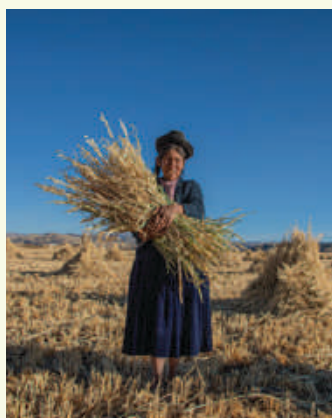
季秋—宜：「乃命冢宰，農事備收。」 (《禮記·月令》)