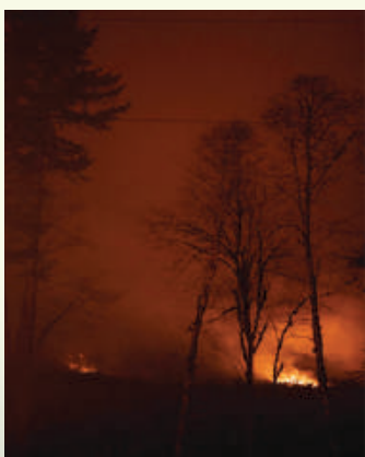
仲春—禁：「是月也，毋竭川澤，毋漉陂池，毋焚山林。」 (《禮記·月令》)