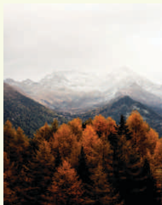
■ 秋—立秋：涼風至，白露降，寒蟬鳴。