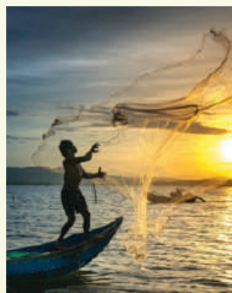
季冬—宜：「是月也，命漁師始漁。」 (《禮記·月令》)