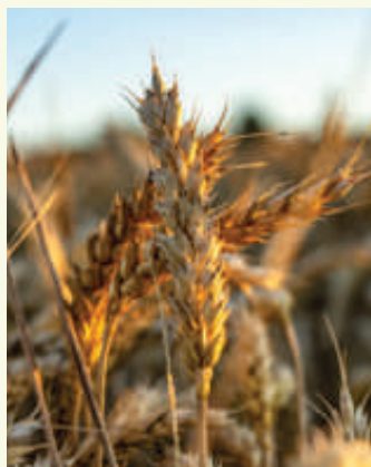
■ 夏—小夏：苦菜秀，靡草死，小暑至。